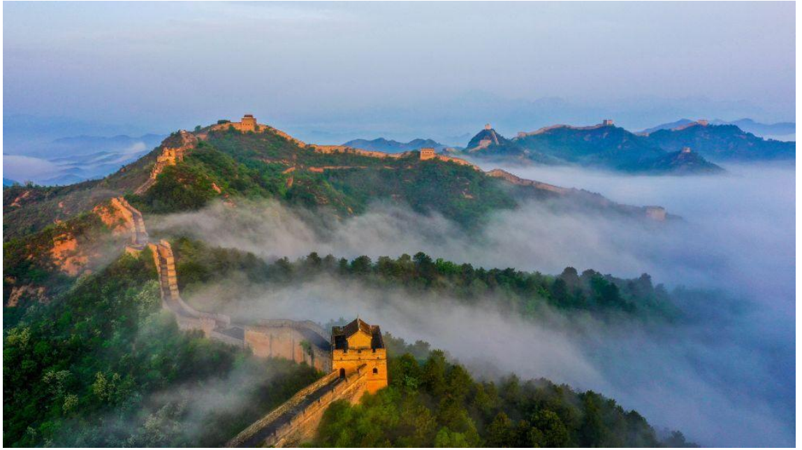
金山岭长城(2023年5月12日摄,无人机照片)。